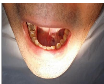
تصویر ۶-الف: نمای اکلوزالی فوتوگرافی از بیمار بعد از خارج کردن سنگ بزاقی