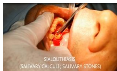
تصویر ۵-ب: خارج کردن سنگ بزاقی