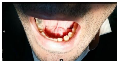
تصویر ۱-الف: نمای بالینی از برجستگی یک طرفه مختصر ایجاد شده در کف دهان