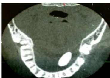
تصویر ۴-ج: نمای اکزیال تصاویر CBCT

بود. گرافی O.P.G سوپرایمپوزیشن سنگ در ناحیه پرمولرهای سمت چپ بیمار را نشان می دهد. (تصویر ۴-الف)