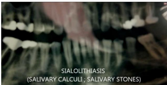
تصویر ۴-الف: رادیوگرافی پانورامیک از سنگ که توسط دندانپزشک قبلی تجویز شده بود

"کو آموکسی کلاو" هر ۶ ساعت)، استفاده از دهانشویه آنتی سپتیک و بی حس کننده موضعی "دیفن هیدرامین" در صورت سوزش محل جراحی، داده شد. توده سنگ بزاقی خارج شده به رنگ زرد کرمی با اندازه ۳۲ \times ۱۶ میلی متر بود. (تصویر ۶-ب) پس از یک هفته جراحی سنگ مجرای غده بزاقی، بیمار احساس راحتی هنگام غذا خوردن و رفع مشکلات قبلی را ذکر می نمود.