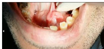
تصویر ۱-ب: همان نما از نزدیک

بیمار عنوان می کرد که نتیجه آسپیراسیون از ضایعه توسط دندانپزشک قبلی، خارج شدن چرک و خون بوده است. به منظور بررسی بیشتر، معاینات بالینی از بیمار به عمل آمد. در معاینات کلینیکی بیمار، در سطح لینگوال و باکال قدام فک پایین هیچگونه اتساع استخوانی مربوط به ضایعه دیده نشد و پری وستیبول هم وجود نداشت. (تصویر ۳)