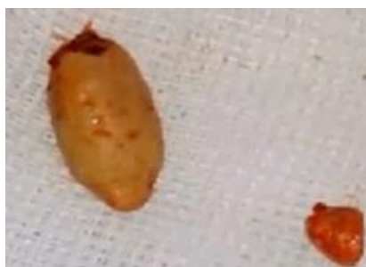
تصویر ۶-ب: نمای سنگ خارج شده با اندازه قابل توجه همراه با یک تکه سنگ بزاقی کوچک