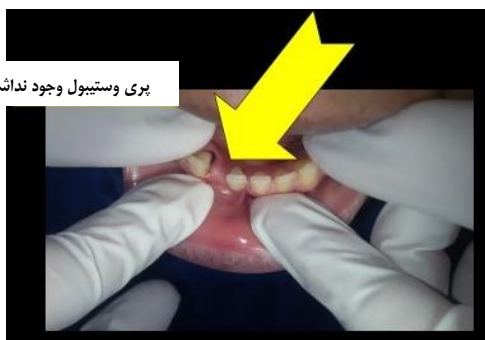
تصویر ۳: پری وستیبول دیده نشد.

بیمار عنوان می کرد که نتیجه آسپیراسیون از ضایعه توسط دندانپزشک قبلی، خارج شدن چرک و خون بوده است. به منظور بررسی بیشتر، معاینات بالینی از بیمار به عمل آمد. در معاینات کلینیکی بیمار، در سطح لینگوال و باکال قدام فک پایین هیچگونه اتساع استخوانی مربوط به ضایعه دیده نشد و پری وستیبول هم وجود نداشت. (تصویر ۳)