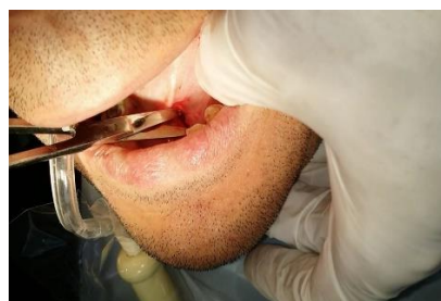
تصویر ۵-الف: باز کردن دهانه مجرا

مکانیسم دقیق تشکیل سنگ هنوز اثبات نشده ولی تصور می شود به دلیل عدم فعالیت ترشحی، میکروکلکولوس ها به مرور زمان در مجاری بزاق تشکیل می شوند. (۹و۱) همان طور که می دانیم یکی از علائم سنگهای بزاقی تورم حاد متناوب می باشد که شدت علائم بسته به میزان انسداد و حضور عفونت ثانویه است. معمولاً