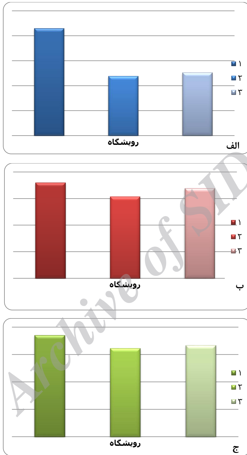
شکل ۲. شاخص آلودگی فلزی برای هر رویشگاه (الف- رسوب، ب- ریشه، ج- برگ)