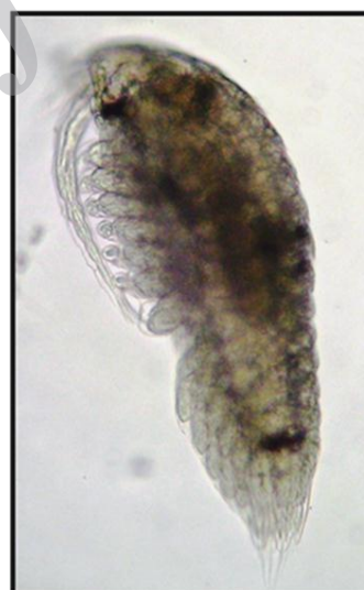
شکل ۴- گونه Sapphirina nigromaculata : نمای جانبی جنس نر (×۲۰) (پیغان، ۱۳۹۰)

اولین بند مخرجی در نرها کوچک است و فورکا به صورت برگی شکل درآمده است که شکل دقیق آن در گونه های مختلف متفاوت می باشد. آنتنول از ۵ بند تشکیل شده است (شکل ۴).