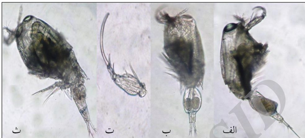
شکل ۳- گونه Corycaeus andrewsi (نر: الف) نمای جانبی، (ب) نمای پشتی (×۲۰)، (ت) آنتن دوم (×۴۰)- ماده: (ث) نمای پشتی (×۲۰) (پیغان، ۱۳۹۰).

می‌باشد. بند جنسی ۱/۵ برابر بند مخرجی طول دارد. فورکا ۵ برابر پهنایش طول دارد و یک سوم یوروزوم را شامل می‌شود (شکل ۳-ث).