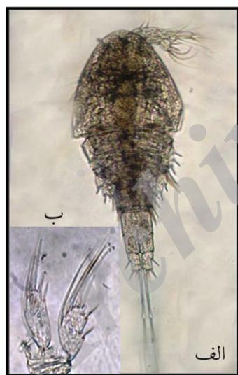
شکل ۵- الف) مرحله لاروی کوپه پودیت (I) جنس Hemicyclops (×۲۰)، (ب) پای دوم شنا (×۴۰) (پیغان، ۱۳۹۰)