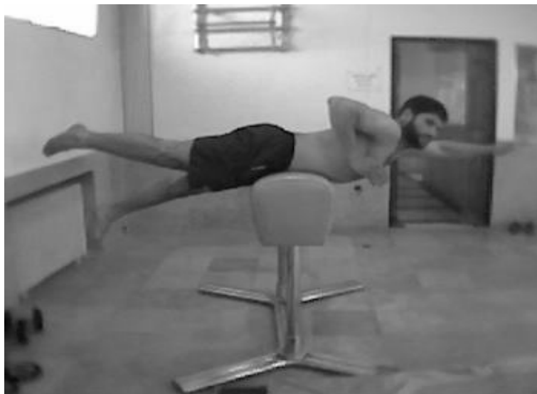
تصویر - ۱