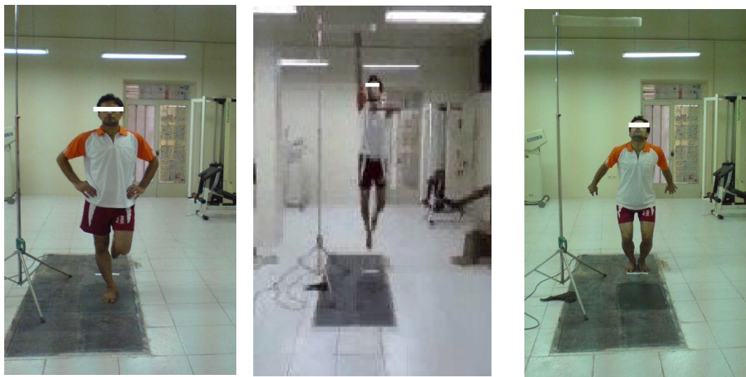
شکل ۱: پروتکل پرش- فرود: از سمت راست قبل از پرش، حین پرش و فرود

بالای آن علامتی به سمت صفحه نیرو کشیده می‌شد. ارتفاع این علامت معادل نقطه ۵۰ درصدی حداکثر پرش ارتفاع آزمودنی بود. سپس در فاصله ۷۰ سانتی‌متری مرکز صفحه نیرو روی سطح زمین نقطه‌ای مشخص و علامت‌گذاری شد. از آزمودنی خواسته شد تا از پشت فاصله ۷۰ سانتی‌متری علامت‌گذاری شده، با دو پا پرش کرده و پس از لمس علامت بالای صفحه نیرو (که نشانگر ۵۰ درصد حداکثر ارتفاع آزمودنی می‌باشد) با یک پا (پای غالب) در مرکز صفحه نیرو فرود آمده و به محض استقرار، دست‌ها را در ناحیه لگن قرار داده، سر را بالا نگه داشته و روبرو را نگاه کند و سعی کند که تعادلش را حفظ نماید (شکل ۱). قبل از این‌که از آزمودنی آزمون پرش- فرود به عمل آید از وی خواسته شد تا حرکت پرش- فرود را چند بار انجام داده تا با شرایط و نحوه اجرای آزمون آشنا گردد. آزمون‌گر نیز در این حالت نحوه حرکت پرش را به آزمودنی آموزش می‌داد و هنگامی که آزمودنی اعلام آمادگی می‌کرد از وی آزمون به عمل می‌آمد. هر آزمودنی مانور پرش- فرود را سه مرتبه اجرا نمود. اطلاعات نیروهای عکس‌العمل زمین توسط صفحه نیرو از لحظه‌ای که پای فرد با صفحه نیرو تماس می‌یافت به مدت ۲۰ ثانیه ثبت شد. اطلاعات نیروی عکس‌العمل در دو راستای جانبی و قدامی- خلفی توسط صفحه نیرو با فرکانس نمونه‌برداری ۲۰۰ HZ ثبت شد. این اطلاعات روی دستگاه رایانه ذخیره شد تا جهت تجزیه و تحلیل بعدی مورد استفاده قرار گیرد (۳، ۴۱، ۴۲).