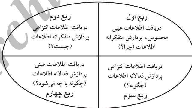
تدریس چهار بخش (4MAT)

مک کارتی (۱۹۹۰) شیوه تدریس تمام مغزی (چهار بخش) را ارائه کرده است؛ این شیوه که شامل چهار سبک یادگیری است در هشت گام به اجرا در می آید و فعالیت نیم کره راست و نیم کره چپ را به هم پیوند می زند. شیوه تدریس تمام مغزی نقشه ای برای چگونگی برنامه ریزی و ارائه آموزش فراهم می کند تا تمامی فراگیران در همه گروه های سنی که سبک یادگیری متفاوتی دارند، بهره ببرند. در طول گامهای تدریس به شیوه آموزش تمام مغزی نقش معلم تغییر می کند تا دانش آموزان مسئولیت یادگیری را خود بر عهده گیرند. پژوهشها نشان می دهند که این شیوه انگیزه دانش آموزان را افزایش می دهد. اگرچه روشهای تدریس فراوانی وجود دارند اما شیوه چهار بخش به الگوی تمام مغزی نزدیک تر است زیرا آن هم به دریافت و هم به پردازش اطلاعات می پردازد. به علاوه مطابق پژوهشهای عصب شناختی شیوه چهار بخش ترجیحات نیم کره های مغز فراگیران را مورد اهمیت قرار می دهد.