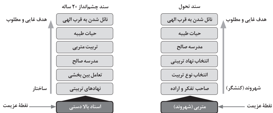
نمودار ۱. مسیر تربیت شهروندی مطلوب در سند تحول و سند چشم‌انداز

بر مبنای یافته‌های پژوهش، رویکرد جمهوری اسلامی در تربیت دانش‌آموزان به‌عنوان شهروند، با تحلیل محتوای کیفی اسناد مربوطه و کاهش و کدگذاری مباحث در فرایند مقوله‌سازی و زیرمقوله‌های آن، نگرش سیاست رسمی به اجتماعی کردن دانش‌آموزان، نوعی شهروند دینی - اجتماعی مفهوم‌سازی شد. اما برای رسیدن به این مطلوب، هر کدام از اسناد مسیر متفاوتی را برای رسیدن به هدف غایی مشترک که همانا قرب الهی است، طراحی می‌کنند؛ اگرچه هر کدام به مسیر با نقطه شروع متمایز برای تربیت شهروندی توجه دارند: سند تحول و مبانی نظری آن در بطن مفهومی خود رویکرد فردمحوری دارد، نهادهای مرتبط، حیات طیبه، و مدرسه صالح را برای تربیت لازم می‌داند، و سند چشم‌انداز که تا حدود زیادی نهاد محور است، دولت و نظام رسمی را مبنای شروع تربیت این سوژه می‌داند، اما به این نکته اشاره می‌کند که چنین شهروندی در نهایت باید خودارزیاب، منتقد، مشارکتی و... از دل این نهادها و ساختار خارج شود. مسیر تربیت شهروندی در نمودار ۱ بهتر نمایان است.