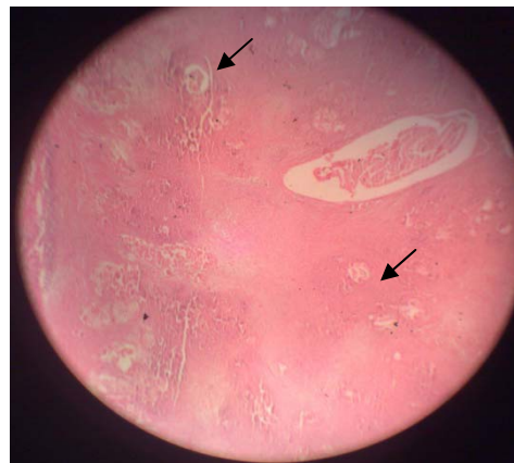
تصویر ۲: نمای میکروسکوپی از کبد بیمار با بزرگنمایی \times 140 و رنگ آمیزی H & E فلش‌ها نشان‌دهنده کیست‌ها می‌باشد.

با سپاس از متخصصین محترم بهوشی و همکاران در اتاق عمل بیمارستان ۲۲ بهمن مشهد.