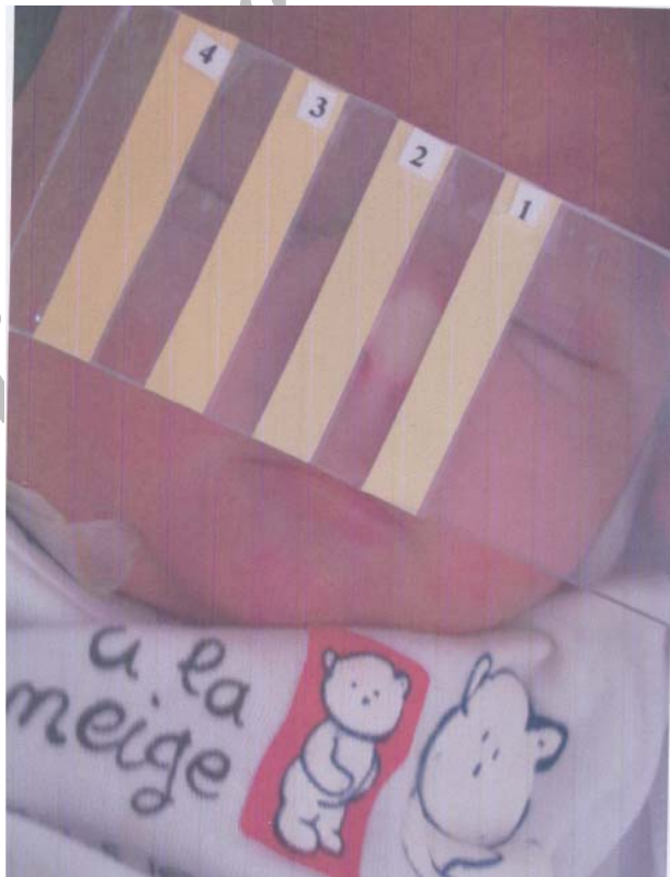
شکل ۳- تصویری از ایکترومتر تهیه شده در این مطالعه برای سنجش زردی نوزادان

منحنی پراکندگی طبیعی در تمامی نوزادان بدست آوردیم. طول موج نور زرد منطبق بر صدک ۵۰ و ۹۵ بیلی‌روبین‌های 50 \text{ mg/dl} ، 10 \text{ mg/dl} ، 15 \text{ mg/dl} ، 20 \text{ mg/dl} را بدست آوردیم. و از طریق این طول موج‌های معین شده نوارهای زرد (۴ عدد) برای هر کدام از صدک‌ها بدست آمد که با استفاده از نوارهای زرد منطبق بر صدک ۹۵ اقدام به تهیه ایکترومتر نمودیم. هر کدام از این نوارها با اعداد ۱ (کم‌رنگ‌ترین) الی ۴ (پررنگ‌ترین) شماره گذاری شد و با چسباندن آن به صورت ردیفی و موازی با فاصله روی یک شیشه نازک (که در نهایت به علت خطر شکستگی شیشه یک صفحه پلاستیکی شفاف جایگزین شد) ایکترومتر تهیه گردید. سپس با