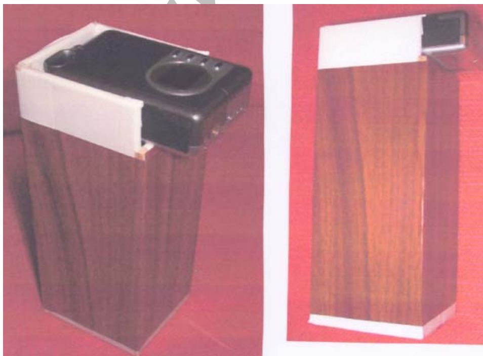
شکل ۱- دستگاه مخصوص عکسبرداری از پوست نوزادان زرد شده بیمارستان نمازی شیراز ۸۴-۱۳۸۳

این مطالعه در نوزادان مراجعه کننده به بخش غربالگری نوزادان بیمارستان نمازی شیراز انجام شد در این مطالعه مقطعی، نوزادانی که با زردی به اتفاقات نوزادان مراجعه می‌کردند مورد بررسی قرار گرفتند به این ترتیب که از هر نوزاد ۲ عکس از قسمت پیشانی نوزاد در حالی که پوست به وسیله یک شیشه فشرده (blanching) شده بود، گرفته شد. با تحت فشار دادن پوست به وسیله شیشه نور قرمز پوست که حاصل رنگ مویرگ های پوستی آن می‌باشد حذف می‌شود. عکس‌ها از طریق