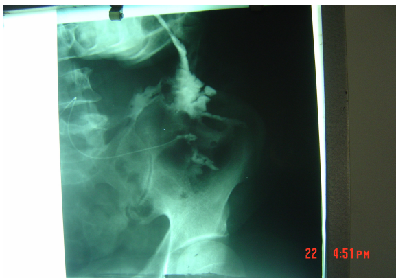
تصویر ۱: فیستولوگرافی قبل از شروع درمان

جهت رد وجود فیستول فیستولوگرافی شد که پس از تزریق ماده حاجب تجمع آن در کاویته بزرگی که حدود نامنظم و Bizzar داشته که بلافاصله در زیر محل درناژ سطحی و تراکتهای متعددی از ضایعه به صورت Sattelate به اطراف که بزرگترین آن رو به بالا ولی ارتباط به جایی نداشت. و حداکثر عمق تراکت ۴ سانتی متر بود که در لابلاهی عضلات پشتی بود شکل‌های (۲۱).