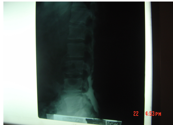
تصویرهای ۱ و ۲:

فیستولوگرافی ۶ ماه پس از درمان ضد بروسلائی فضای بی شکلی که تراکت کوچکی به سمت فوقانی است.