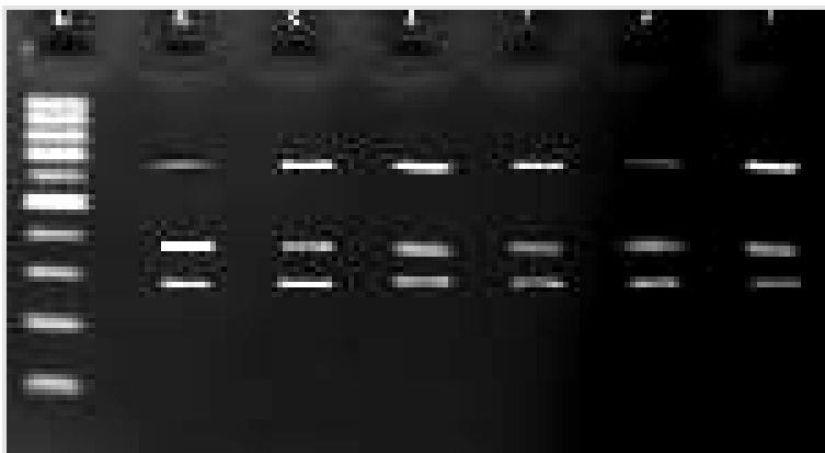
شکل ۱: نتایج حاصل از برش Bsal قطعه ۱۴۰۰ جفت بازی. ردیف شماره ۱ مربوط به سایز مارکر ۱۰۰ جفت بازی و در ردیف‌های ۲ تا ۷ قطعات ۴۰۰، ۳۰۰ و ۷۰۰ جفت بازی جهش A2143G نشان داده شده است.