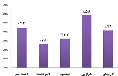
نمودار شماره ۱: درصد آلودگی کنه‌ای در دامهای شهرستان آمل به تفکیک منطقه جغرافیایی (بخش) در سال ۱۳۸۸