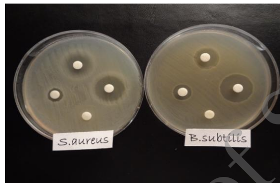
شکل ۲: تاثیر غلظت های مختلف دندریمر PAMAM-G4 بر تشکیل هاله عدم رشد در باکتری های گرم مثبت

جدول ۴ نتایج حداقل غلظت بازدارندگی و حداقل غلظت باکتری ها می شود حداقل غلظت دندریمر که مانع رشد کشتندگی دندریمر پلی آمیدوآمین نسل ۴ را بر روی باکتری های مورد مطالعه نمایش می دهد. همانطور که باکتری های گرم مثبت است.