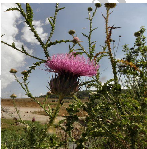
شکل ۱: گونه خارپنبه برگ نازک

خارپنبه برگ نازک از جاده اهواز- مسجدسلیمان (۸۵ کیلومتری اهواز) در خرداد ماه جمع آوری و شناسایی گونه گیاه توسط پژوهشکده گیاهان دارویی دانشکده داروسازی اهواز انجام شد. کد هرباریومی گیاه A14020001P می- باشد.