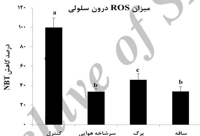
شکل ۳. درصد کاهش NBT در عصاره اتانولی بخش‌های مختلف گیاه خارپنبه برگ نازک با استفاده از دستگاه سوکسله. میانگین سه بار تکرار \pm خطای استاندارد می‌باشد. حروف متفاوت نشان دهنده تفاوت معنی‌دار در سطح p < 0.05 است.

از مقایسه داده‌های به دست آمده از میزان درصد رادیکال‌های آزاد سلول‌های سرطانی تیمار شده با عصاره اتانولی به روش استفاده از دستگاه سوکسله، مشخص شد که تفاوت میانگین کاهش NBT در زمان ۲۴ ساعت در گروه‌های تیمار نسبت به گروه کنترل در سطح p < 0.05 معنی‌دار بود. میزان فعالیت رادیکال‌های آزاد عصاره اتانولی در سه بخش سرشاخه هوایی، برگ و ساقه گیاه خارپنبه برگ نازک اختلاف معنی‌داری داشتند. میزان فعالیت