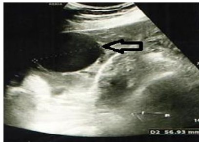
تصویر ۱. سونوگرافی ترانس واژینال. کیست تخمدان راست (فلش سفید)

زننده در رحم و ساک دیگر با جنین دارای قلب و سن بارداری ۷ هفته و ۶ روز در آدنکس راست و دو کیست ۳۷ و ۵۶ میلیمتری با جدار صاف در آدنکس راست به همراه مایع آزاد در شکم و لگن تا زیر هر دو دیافراگم گزارش گردید (تصاویر ۱ و ۲).