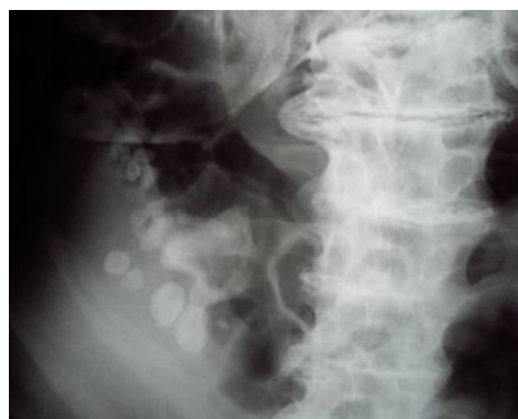
شکل (۱): استئوفیتوزیس مهره‌ها، کاهش ارتفاع فضای مفصلی، سنگ‌های کلیوی

نمونه رسیده به بخش پاتولوژی شامل سر مفصل هیپ به قطر ۵ سانتی‌متر و به رنگ سیاه همراه با سه تکه بافت نرم خاکستری رنگ مجموعاً به ابعاد 1/2 \times 2 \times 3 سانتی‌متر بود (شکل ۳). مطالعه هیستولوژیک نمونه، نشان‌دهنده تغییر رنگ قهوه‌ای غضروف، جایگزینی کانونی فیبروز به جای غضروف، تکه‌های فرو رفته غضروف تخریب شده به داخل بافت فیبروز (shard)، ارتشاح خفیف سلول‌های التهابی تک هسته‌ای و سلول‌های چند هسته‌ای گول آسا به فرم جسم خارجی بود (شکل ۴).