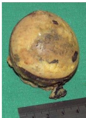
شکل (۳): تیرگی سر مفصل ران