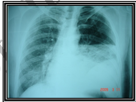
تصویر شماره (۱): هیدروپنوموتوراکس

شدت بی‌حال و دهیدراته بود. علائم حیاتی بیمار به ترتیب زیر بود: P.R:110/min, R.R:24/min Axillary Temp.38/5. در آزمایش خون لوکوسیتوز و انحراف به چپ شدید داشتند (۲۳۰۰۰) در هر سانتی مترمکعب و ۹۳ درصد نوتروفیل. در مرور شرح حال بیمار پرخوری و مصرف مواد مخدر را ۲ ساعت قبل از شروع علائم ذکر کردند. با توجه به شرح حال و یافته‌های گرافی سینه برای بیمار لوله سینه تعبیه شد که حدود ۵۰۰ سی سی مایع کدرو خارج شد. پارگی مری و پانکراتیت به عنوان تشخیص اول مطرح شدند. که با توجه به فاصله کم بین شروع علائم و افیوژن نسبتاً زیاد محتمل‌ترین تشخیص پارگی مری بود. مطالعه با ماده حاجب انجام شد که با نشان دادن نشت ماده حاجب تشخیص را اثبات کرد (تصویر ۲).