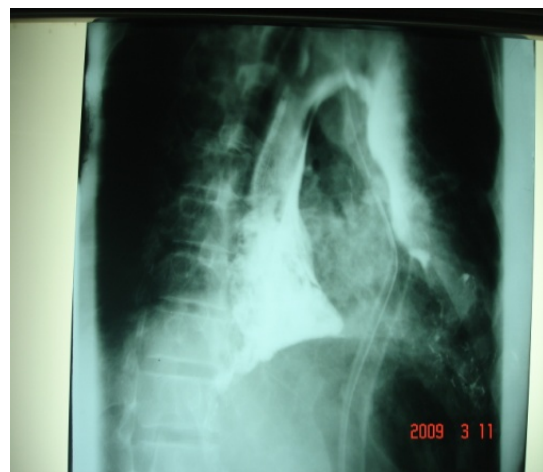
تصویر (۲): نشت ماده کنتراست

بیمار آماده عمل شد و تحت توراکوتومی پوسترولترال چپ قرار گرفت. حدود ۲ لیتر چرک و مواد غذایی از قفسه سینه خارج شد. بعد از خارج کردن ترشحات بررسی‌ها نشان دهنده پارگی ۶-۵ سانتی‌متری در دیستال مری بود تصویر شماره (۳).