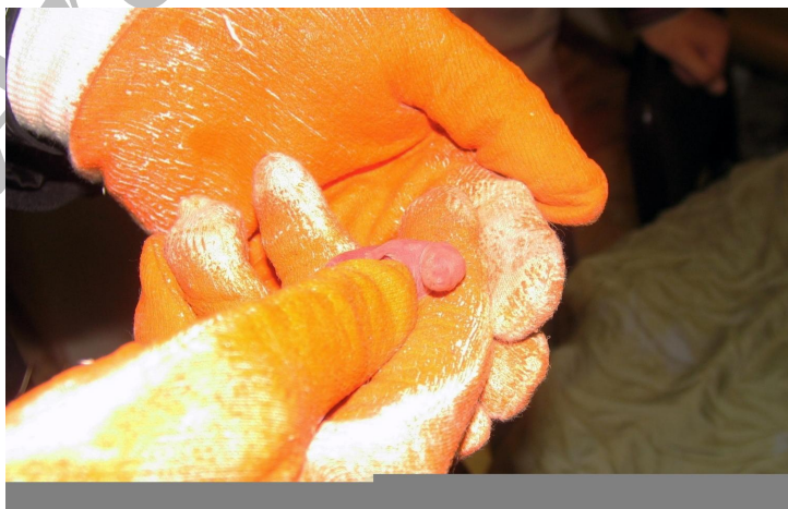
تصویر شماره (۴)