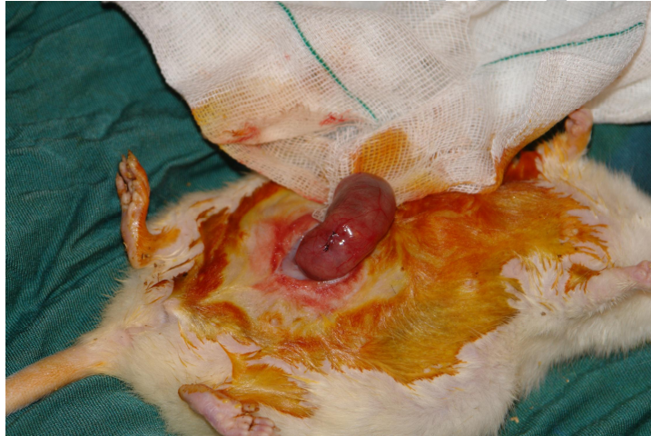
تصویر شماره (۳)