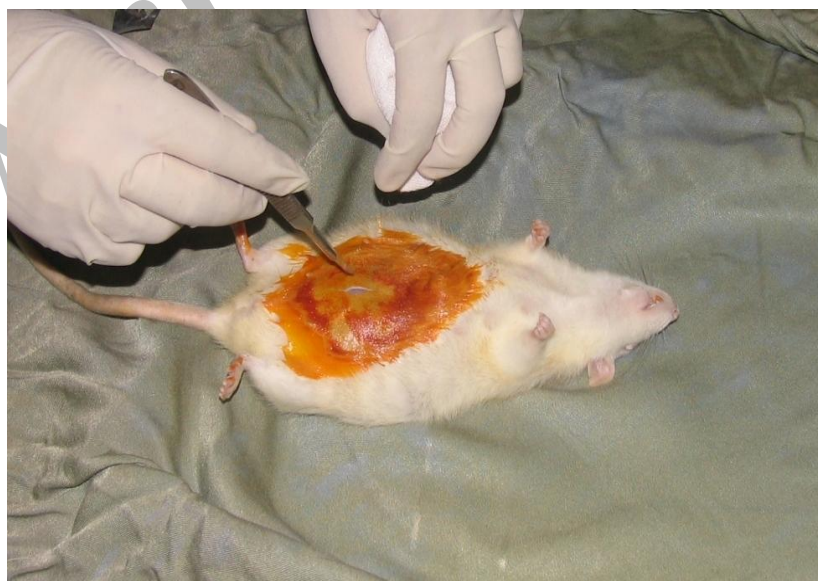
تصویر شماره (۱)