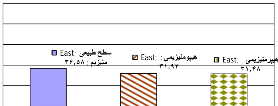
نمودار شماره (۴): توزیع فراوانی نسبی سطح منیزیم در جمعیت مورد مطالعه

جدول شماره (۱): میانگین سن، سطح سرمی منیزیم، طول مدت بستری در ICU، بیمارستان و طول مدت تهویه مکانیکی در جمعیت