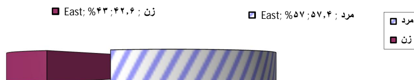
نمودار شماره (۲): توزیع فراوانی نسبی جمعیت مورد مطالعه برحسب جنس