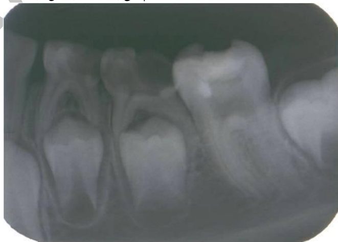
شکل (۱): دندان مولر اول مندیبل با پوسیدگی وسیع تاجی و ریشه نابالغ نکروز

از آنجاییکه در روش‌های سنتی درمان دندان‌های نابالغ مانند آپکسیفیکیشن بدلیل عدم تکامل ریشه و نازک بودن دیواره‌های عاجی احتمال شکستگی ریشه بسیار بالاست، فراهم کردن شرایطی که ریشه دندان روند تکامل خود را طی کند و ریسک شکستگی ریشه و در نهایت از دست دادن کامل دندان کاهش یابد، نظیر درمان‌های رژئراسیون از اهمیت بسیاری برخوردار است. هدف از این گزارش مورد، القاء تکامل ریشه مولر اول دائمی نابالغ با