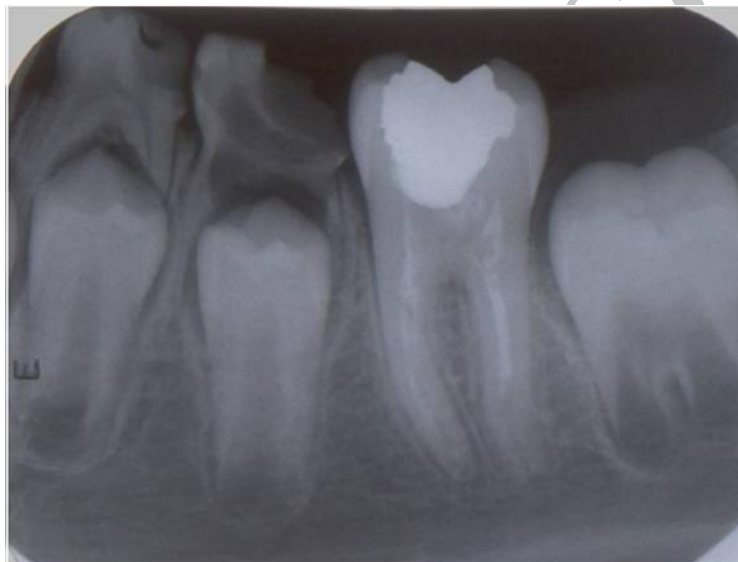
شکل (۳): تصویر پری آپیکال دندان یکسال پس از درمان که نشان دهنده تکامل ریشه می باشد.

مطالعات متعددی در زمینه مهندسی بافت جهت بازسازی ارگان فانکشنال عاج-پالپ در آپکس ریشه به منظور تکامل ریشه انجام شده است. تمامی این مطالعات بر اساس نقش سلول‌های بنیادی در رژنراسیون دندان می‌باشند (۱۲). در طی دهه اخیر، سلول‌های بنیادی از بسیاری از بافت‌ها جدا شده‌اند و جهت اهداف مهندسی بافت و کاربردهای کلینیکی مربوطه مورد مطالعه قرار گرفته‌اند. سلول‌های بنیادی پالپ دندان (DPSCs) از پالپ دندان بزرگسال جدا شده‌اند و پتانسیل بالایی برای خود-نوزایی و نیز تمایز به کندروبلاست ها، استئوبلاست ها، نرون ها و سلول‌های چربی و سلول‌های شبه ادنتوبلاست دارند (۱۳، ۱۴). همچنین به علت بیان برخی آنتی ژن‌های ویژه سطحی سلولی مانند CD-44, CD90