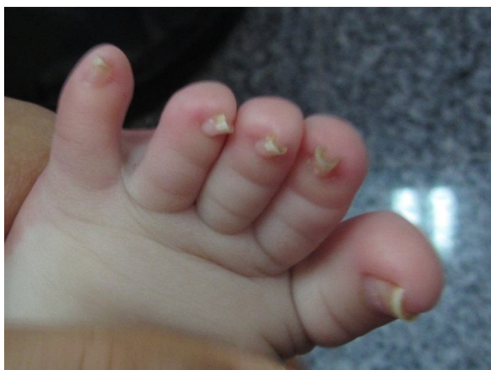
شکل (۳): تغییر شکل گازانبری به‌طور منتشر در ناخن‌های پا