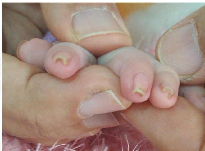
شکل (۱): تغییر شکل گازانبری در ناخن‌های دست

در اکوکاردیوگرافی‌های بعدی چهار ماه بعد از ترخیص بیمار، خوشبختانه آنوریسم در عروق کرونر بهبود یافته بود و به خاطر آن وارفارین قطع‌شده و فقط آسپیرین با دوز ضد انعقادی به بیمار داده شد. در مراجعات بعدی یک سال بعد از ترخیص، شیرخوار حال عمومی خوب را داشته و در بررسی‌های اکوکاردیوگرافیک آنوریسم در عروق کرونر کاملاً بهبود یافته بود.