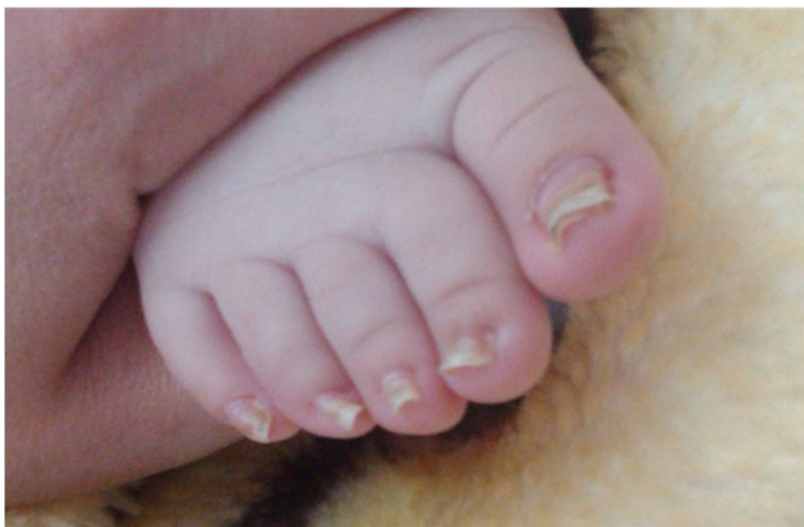
شکل (۲): تغییر شکل گازانبری به‌طور منتشر در ناخن‌های پا