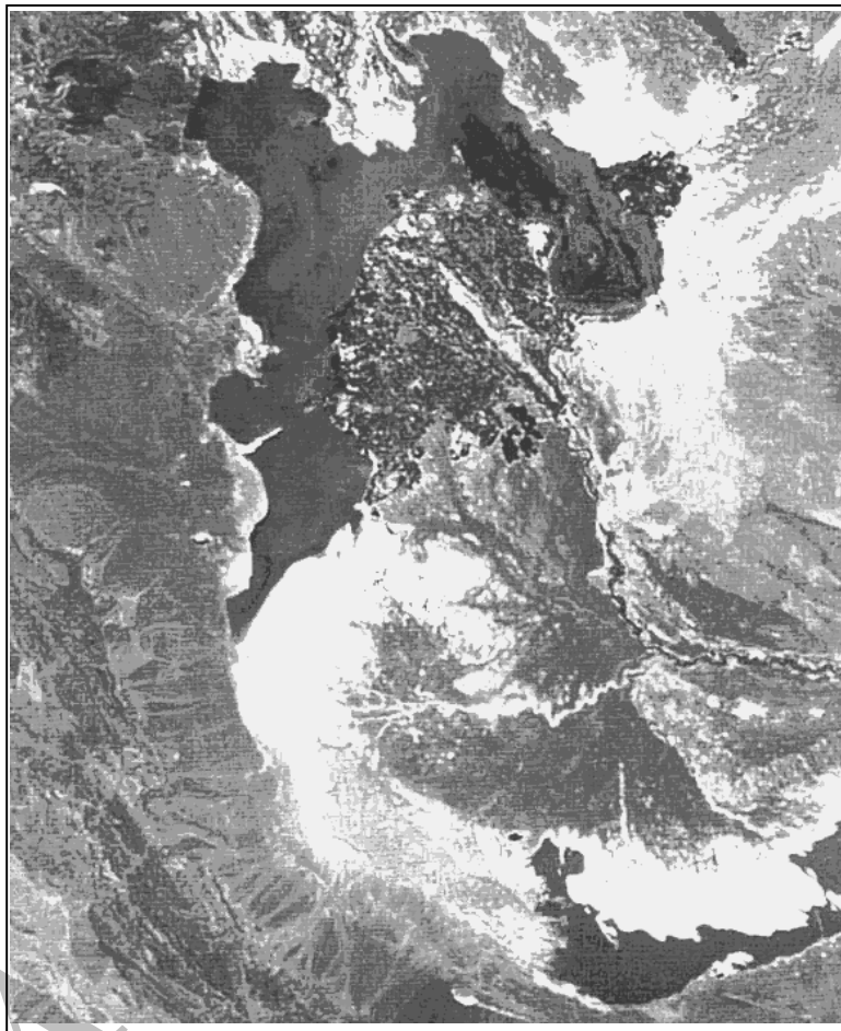
تصویر ۳: تصویر ماهواره‌ای از منطقه‌ی سیستان که در آن مسیرهای قدیمی و فعلی رودخانه‌ی هیرمند مشخص می‌باشد (تاریخ عکس برداری ۲۶ فروردین ۱۳۷۷)

دو کشور به دلیل همین تغییر مسیرهای هیرمند و شاخه‌های آن بوده است. اینک عطف توجه به این مهم و پی‌جویی روندهای آینده آن بر مبنای روندهای گذشته، می‌تواند راهبردهای روشنی را در مواجهه با این پدیده و کنترل و مهار آثار و تبعات سیاسی، اجتماعی و اقتصادی آن، فراروی برنامه‌ریزان سیاستگذاران ملی و منطقه‌ایی قرار دهد.