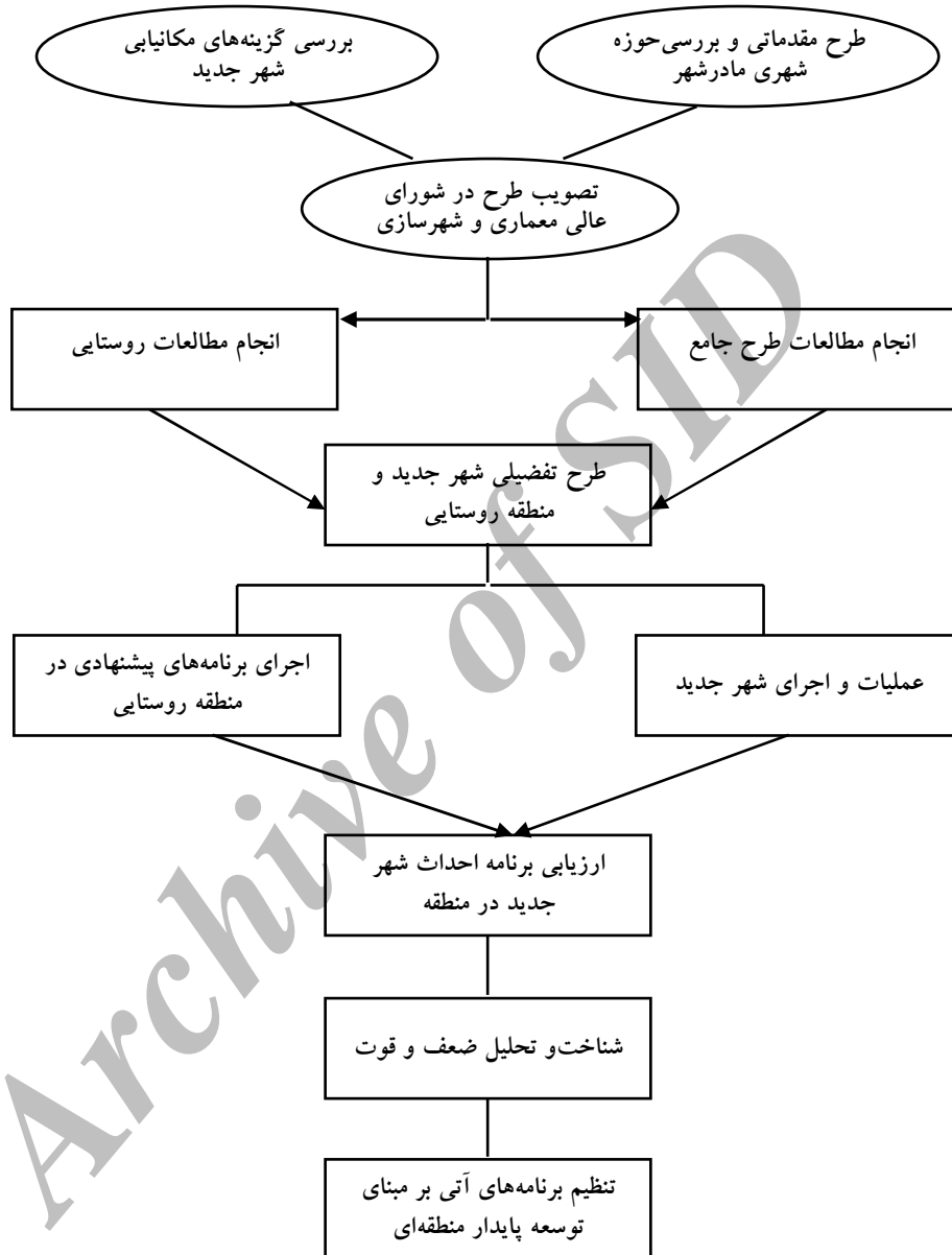
مدل پیشنهادی انجام مطالعات روستایی در فرآیند احداث شهر جدید