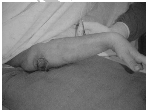
شکل ۴- محل ونوتومی ترمیم می‌شود

یا گرفت‌های شریانی- وریدی، علاوه بر هزینه کمتر، میزان عفونت پائین‌تر، پروسه‌های جراحی کوچک‌تر و نیز میزان پائین‌تری از مرگ و میر را دربر دارد. (۲-۴) بیماران کاندید برقراری AVF برای پیشگیری از بروز عوارض جدی، باید قبل از عمل جراحی بدقت تحت بررسی قرار گیرند و درست انتخاب شوند. بعنوان مثال، وجود تنگی یا ترومبوز در وریدهای سطحی یا عمقی باعث ایجاد هیپرتانسیون وریدی بدنبال برقراری AVF می‌شود (۵)، یا وجود نارسایی زمینه‌ای شریانی که تشخیص داده نشده باشد، باعث ایجاد ایسکمی خطرناک اندام بعد از گذاشتن AVF می‌شود که ممکن است بستن فیستول شریانی- وریدی را ایجاب کند (۶، ۷). تکنیک ناصحیح سوزن زدن و استفاده از فیستول شریانی- وریدی نیز ممکن است باعث ایجاد آنوریسم کاذب و خونریزی تهدید کننده حیات شود (۸، ۹).