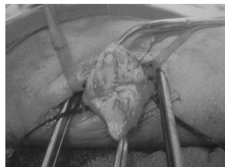
شکل ۳- سوراخ شریانی با استفاده از پرولن ۵ صفر ترمیم می‌شود.