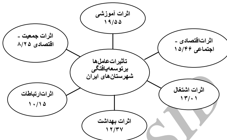
شکل ۱: نسبت تأثیر عامل‌های ۶ گانه در توسعه‌یافتگی شهرستان‌های کشور