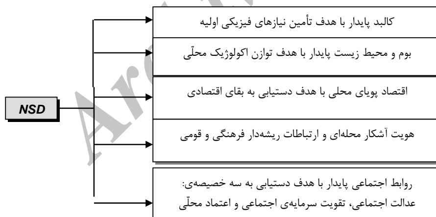
شکل ۱: ارکان توسعه‌ی پایدار محلی

روند حاکم بر فضای اقتصادی محله بهار نیز مانند سایر ابعاد محلی، با شاخص‌های بقای اقتصادی که عنصری کلیدی در توسعه‌ی پایدار اقتصاد محلی است، تناسبی ندارد. این مسأله ضمن اینکه به عنوان عاملی منفی در تداوم سکونت و جذب جمعیت محلی