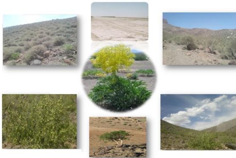
شکل ۲: برخی تیپ‌های گیاهی مراتع مورد مطالعه