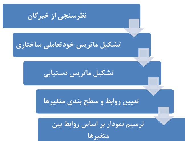
شکل ۱: فرایند مدل ISM

رویکرد مدل‌سازی ساختاری تفسیری یک متدولوژی مؤثر و کارا برای موضوعاتی است که در آن متغیرهای کیفی در سطوح مختلف اهمیت بر یکدیگر آثار متقابل دارند (باقری‌نژاد و همکاران، ۱۳۹۱: ۲۴). این مدل تکنیکی مناسب برای تحلیل تأثیر یک عنصر بر دیگر عناصر است.