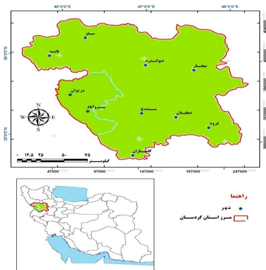
تصویر ۱: نقشه محدوده مورد مطالعه