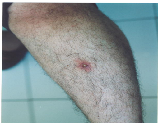
تصویر ۲: ضایعه در قسمت میانی قدامی ساق پای چپ