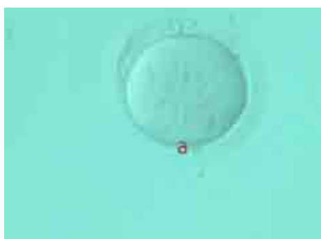
تصویر ۲: تخمک بالغ انسان (a) اولین گویچه قطبی