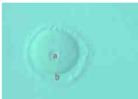
تصویر ۱: تخمک نابالغ انسان (a) ژرمینال و زیگول فضای پری ویتلین (b)