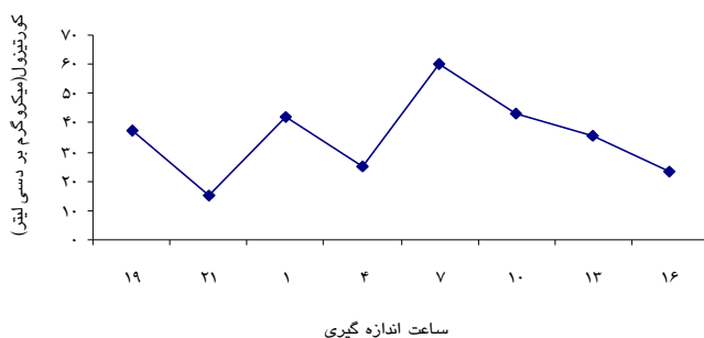
نمودار ۲: نیم‌رخ ترشح کورتیزول در ثابت‌کاران