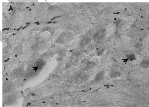
تصویر ۱: سلول‌های نشان‌دار شده با پراکسیداز هورس رادیش در مقاطع گروه شاهد در واکنش با دی‌آمینوبنزیدین (رنگ‌آمیزی زمینه با تیونین، بزرگنمایی ۴۰۰ میکروسکوپ نوری)

شاهد ۴-۲ سلول در هر مقطع و متوسط سلول‌های نشان‌دار شده ۳ سلول مشاهده شد(تصویر ۱). در گروه آزمون ۸-۴ سلول در هر مقطع و متوسط سلول‌های نشان‌دار شده به وسیله ردياب ۶ سلول در هر مقطع وجود داشت که تفاوت آماری معنی‌داری نسبت به گروه شاهد دارد(تصویر ۲) ( P < 0.05 ). کیفیت ماده رنگی دی‌آمینوبنزیدین و رسوب آن در بافت‌های گروه آزمون نسبت به گروه شاهد بیشتر بوده و مشاهده سلول حاوی ماده رنگی دی‌آمینوبنزیدین آسان‌تر می‌باشد(تصویر ۲).