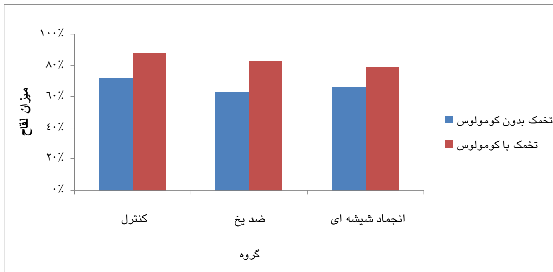
نمودار ۳: مقایسه میزان لقاح تخمک‌های ژرمینال وزیکول با و بدون کومولوس در گروه های کنترل و مداخله