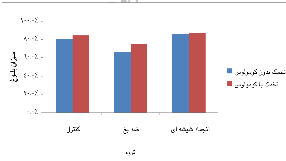
نمودار ۲: مقایسه میزان بلوغ تخمک‌های ژرمینال و زیکول با و بدون کومولوس در گروه های کنترل و مداخله