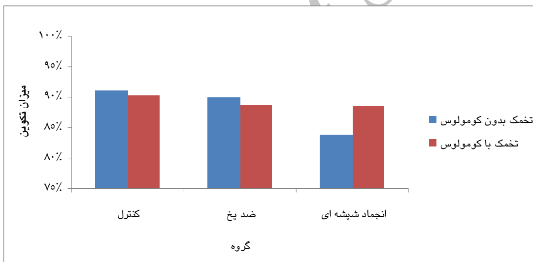
نمودار ۴: مقایسه میزان تکوین به مرحله دو سلولی تخمک‌های ژرمینال وزیکول با و بدون کومولوس در گروه های کنترل و مداخله