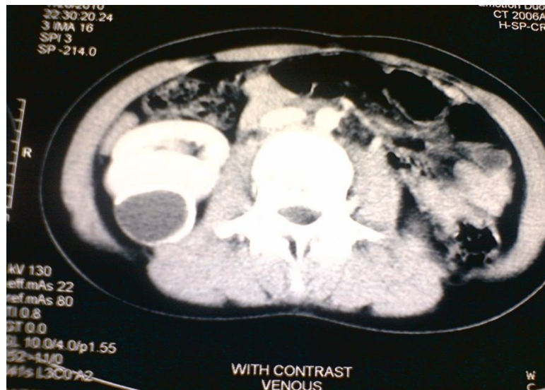
تصویر ۱: سی تی اسکن کیست هیداتید با لایه های داخلی و خارجی کیست در کلیه راست بیمار قبل از عمل جراحی