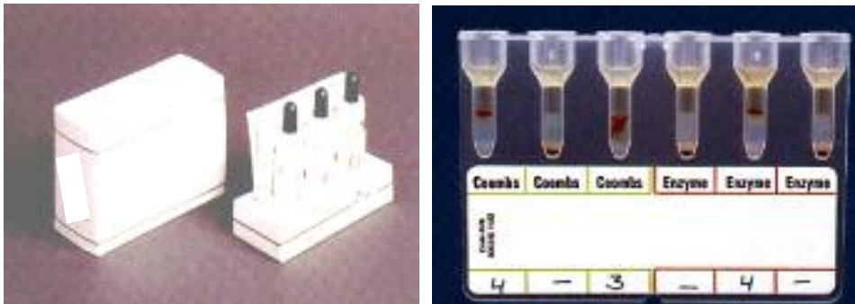
شکل ۱: نمونه لوله‌های سلول‌های غربالگر (۳، ۲، ۱: Dia cell) و محیط ژل که در دو سیستم Liss coombs و آنزیم انجام می‌شود

مشخص (cell 1P & 2P & 3P) بودند، استفاده شد. مراحل انجام آزمایش و نحوه انکوباسیون و سانتیفریژ همانند آزمایش غربالگری انجام شد و پس از پایان مراحل ذکر شده، الگوی واکنش با استفاده از جدول همراه پانل‌ها خوانده و نوع آنتی‌بادی مشخص شد (شکل ۳).