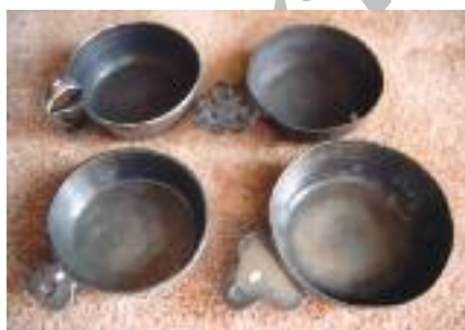
شکل ۲: نمایی از ظروف جمع‌آوری خون در حجامت (۱۸۵۰-۱۷۷۰) (۱۰)

در اواسط قرن ۱۸ به نظر می‌رسد که گرفتن خون روش استاندارد برای درمان تب به حساب می‌آمده، هر چند که این روش برای درمان تب‌های عفونی مانند تیفوئید یا تیفوس کاربردی نداشته است (۸). خونگیری تا پرشدن یک لیتر ادامه می‌یافت که تقریباً معادل ۲۰ اونس (۵۸۰ میلی‌لیتر) است و این میزان می‌توانست تا ۲۵ اونس (۷۲۰ میلی‌لیتر) ادامه یابد. اولین خونگیری تا زمانی که بیمار از حال بروید (Faint) ادامه داشت (شکل ۲) (۹).