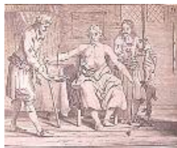
شکل ۱۰: تصویری از انتقال خون گوسفند به انسان (۱۶۹۳) (۲)