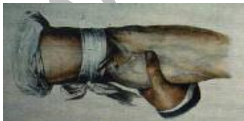
شکل ۷: خونگیری از ورید (۱۰)

ابزارهای به کار رفته شامل لانست و Fleam می‌باشند. لانست شستی کوچک با نوک تیز، ابزار جراحی است که برای فلپوتومی انسان به کار می‌رفت. بازوی بیمار در بالای آرنج با یک نوار پارچه‌ای محکم بسته می‌شد تا ورید را فشار دهد. اما نه آن قدر محکم که نبض شریان را کاهش دهد. تیغه لانست بین شست و انگشت سبابه قرار می‌گرفت و دست با سه انگشت دیگر حمایت می‌شد. سپس لانست در یک جهت وارد ورید می‌شد تا خون از این نقطه بیرون آید. لبه فوقانی لانست در یک خط مستقیم کشیده می‌شد تا پوست را هم سایز ورید زخم کند.