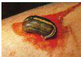
شکل ۹: خونگیری توسط زالو (۲۱)

هنوز در داروخانه‌های قدیمی آمریکا برای درمان زخم‌های ساده دیده می‌شدند (۲۳، ۲۲).