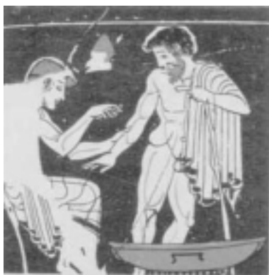
شکل ۱: پزشکی (ایاتروس) در حال حجامت بیمار (۴۸۰ تا ۴۷۰ قبل از میلاد) (۶)

حجامت توسط مصری‌های اطراف رود نیل، چند هزار سال قبل از میلاد مسیح به کار رفته و این سنت به یونان و روم گسترش یافته است که شاهد آن وجود یکی از قدیمی‌ترین اسناد موجود می‌باشد که در آن حجامت از ۳۳۰۰ سال قبل از میلاد مسیح، در مقدونیه انجام می‌شده است و بعدها از مقدونیه به یونان باستان رخنه کرده است (شکل ۱) (۴).