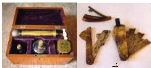
شکل ۵: الف: چند لانست با روکش شاخ حیوانات ب: جعبه وسایل حجامت انگلیسی (۱۰)

روشی سنتی بود. ۳- لانست فنری (Spring Lancet): چاقوی حجامت مکانیکی که به سطح پوست ضربه می‌زند. ۴- خراش‌گذار (Scarificator): حامل فلزی با چندین لبه تیز تیغ‌دار (۷).