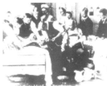
شکل ۱۲: انتقال خون در بیمارستان Bellevue نیویورک (۱۸۷۶) (۳۰)

درمان توسط خون (Hemotherapy) در سیر تکاملی خود از اهدافی مانند خارج ساختن شیطان و ارواح خبیث و کنترل اخلاط چهارگانه به تغییر خلق و خوی بد انسان‌ها رسید و پس از آن در حال حاضر به عنوان علمی جدید در رشته پزشکی به نام طب انتقال خون برای جایگزینی در کمبودهای خونی و به هنگام از دست دادن خون شناخته می‌شود که نیاز به تکامل بیشتری دارد (۲۷).