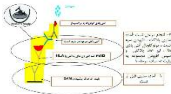
شکل ۳: مکانیسم شماتیک آزمایش MAIPA

قبلی حساس‌تر می‌باشد. ابتدا کف حفرات یک پلیت ته صاف را با آنتی‌بادی بز علیه آنتی‌بادی‌های موش (GAM= Goat Anti Mouse) پوشانده و پلیت تا زمان مصرف در یخچال نگهداری می‌شود. سپس پلاکت‌های افراد سالم با گروه خونی O پس از جداسازی، شستشو و شمارش به تعداد معینی در کف پلیت دیگری افزوده می‌شوند. سرم بیمار و سرم کنترل را به پلیت دوم اضافه و انکوبه نموده و سپس مراحل شستشو و سانتریفوژ با دقت انجام می‌گیرند. در صورت وجود آنتی‌بادی در سرم یا پلاسما بیمار، به آنتی‌ژن‌های HLA یا HPA روی GPS سطح پلاکت‌ها وصل می‌گردند. جهت تعیین نوع آنتی‌بادی‌ها به نحوی عمل می‌شود که مونوکلونال آنتی‌بادی‌های (mAbs) از نوع موشی ضد آنتی‌ژن‌های HLA یا GPS پلاکت انسانی، پس از رقیق‌سازی به حفرات پلیت افزوده و انکوبه شوند (هر یک از آنتی‌بادی‌ها به حفرات جداگانه‌ای اضافه می‌شوند) که هر آنتی‌بادی به آنتی‌ژن مربوط به خود در سطح پلاکت‌ها وصل گردد. در این مرحله با استفاده از یک بافر خاص، سلول‌ها لیز شده و پس از مراحل سانتریفوژ بقایای استرومای سلول رسوب و محلول رویی حاصل از لیز سلول به حفرات پلیت اول پوشیده با GAM اضافه می‌شوند. گلیکوپروتئین‌های غشای پلاکتی در لیز سلولی با آنتی‌بادی‌های گلیکوپروتئینی پوشیده شده که از آن طریق به آنتی‌بادی GAM کف حفرات متصل می‌گردند. پس از مراحل شستشو، آنتی‌سرم انسانی متصل به آنزیم (کونژوگه) اضافه و پس از افزودن سوبسترای لازم، تغییر رنگ ایجاد شده بیانگر وجود آنتی‌بادی‌های اختصاصی پلاکتی است (۵۵، ۵۶) (مکانیسم مربوطه را در شکل ۳ نشان داده‌ایم).