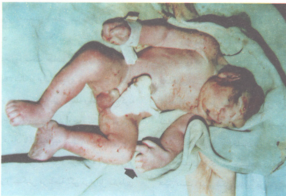
تصویر (۲): پیکان، نشان‌دهنده قطع عضو تعدادی از انگشتان دست چپ است.