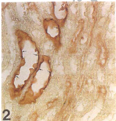
تصویر ۲: بزرگنمایی سمت چپ و بالای تصویر شماره ۱ می‌باشد. فلش‌ها به واکنش شدید لوله‌های جمع کننده ادرار به لکتین PNA را به خوبی نشان می‌دهند. درشت نمایی ۱۰×۴۰

بافر فسفات رقیق شده به نحوی که در هر میلی‌لیتر بافر ۱۰ میلی‌گرم ماده موثر وجود داشت، PH=7/2 و لکتین‌ها به مدت دو ساعت بر روی برش‌ها در درجه حرارت آزمایشگاه قرار داده شدند و سپس به مدت ۱۰ دقیقه در مجاورت DAB ۱ و آب اکسیژنه قرار گرفتند. قسمت‌هایی از بافت‌های کلیه که با هر کدام از لکتین‌ها واکنش نشان داده بودند به رنگ قهوه‌ای درآمده و از بقیه نواحی متمایز گردیدند که نشانه وجود قندهای مورد نظر می‌باشد. جهت رنگ آمیزی زمینه از آلکسین بلو با PH=2/5 استفاده گردید (۲۲ و ۲۶). سپس برش‌ها با میکروسکوپ نوری استاد و دانشجو با دقت مورد مطالعه و بررسی قرار گرفته و از نواحی مورد نظر تصویربرداری انجام شد.