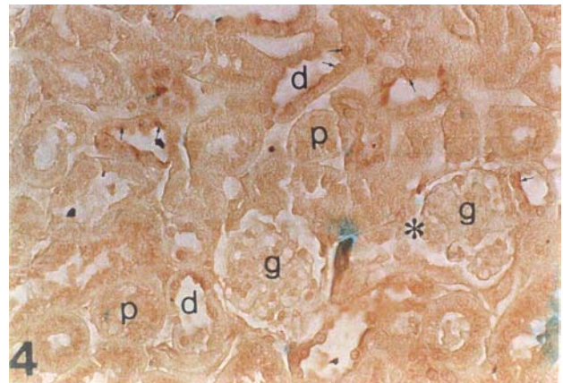
تصویر ۴: مقطع کلیه در ناحیه قشری (Cortex) که با لکتین MPA مجاورت داده شده است. سلول‌های پوشاننده لوله‌های دیستال (d) واکنش داشته که با فلش مشخص شده اند. واکنش در لوله‌های پروکسیمال (P) یکنواخت و ضعیف است. سلول‌های پراکنده ای در گلومرول (g) به MPA واکنش نشان داده اند. درشت نمایی ۱۰×۴۰

لوله‌های پروکسیمال و جمع کننده ادرار در تمام مقاطع آزمایش شده به صورت یکنواخت دیده می‌شوند در حالی که لوله‌های دیستال و گلومرول‌ها هیچ واکنشی نشان نمی‌دهند (تصویر ۳).