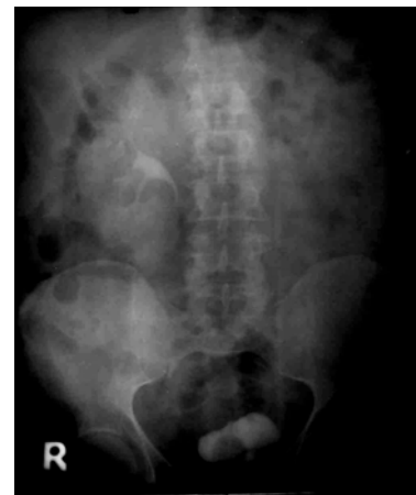
تصویر ۳: IVP، عدم فونکسیون کلیه چپ

هرنیورافی: مثانه در داخل ساک هرنی وجود داشت که بعد از جانداختن آن ساک هرنی ترمیم شد. سپس هرنیورافی به روش باسینی انجام شد و کاتتر فولی گذاشته شد. روز بعد از عمل کاتتر فولی خارج شد که بیمار به راحتی قادر به ادرار کردن بود و تورم در اسکروتوم نیز وجود نداشت.