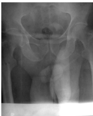
تصویر ۲: سیستوگرافی رتروگراد، فاز Post voiding باقیمانده ادراری به میزان زیاد

در سونوگرافی انجام شده هیدرونفروز شدید کلیه چپ همراه با کاهش قطر کورتکس به ۷ میلی‌متر دیده شد، همچنین بیشتر حجم مثانه در داخل اسکروتوم دیده شد که این وضعیت در سیستوگرافی انجام شده نیز تایید گردید (تصاویر ۱ و ۲).