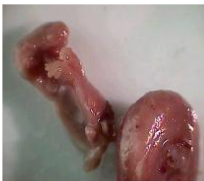
شکل ۱: ناهنجاری شدید جنین در معرض داروی کاربامازپین از گروه تجربی II (دوز ۳۰ mg/kg)

یافته‌های بافتی نشان داد که اپی‌تلیوم قرنیه در نمونه‌های قرار گرفته در معرض دارو، چین خورده و اغلب باریک شده‌اند. عدسی کوچک بوده و تغییر شکل یافته و شبکیه نیز حالت چین خورده داشته و لایه‌های آن تمایز نیافته بودند (شکل ۳).