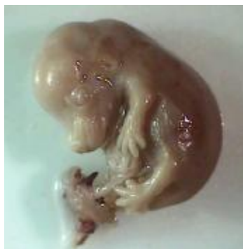
شکل ۲: بروز اگزوفتالمی و باز بودن پلک‌ها قبل از رنگ‌آمیزی در جنین در معرض داروی کاربامازپین از گروه تجربی I (دوز ۱۵ mg/kg)

یافته‌های بافتی نشان داد که اپی‌تلیوم قرنیه در نمونه‌های قرار گرفته در معرض دارو، چین خورده و اغلب باریک شده‌اند. عدسی کوچک بوده و تغییر شکل یافته و شبکیه نیز حالت چین خورده داشته و لایه‌های آن تمایز نیافته بودند (شکل ۳).