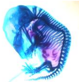
شکل ۴: انواع ناهنجاری‌های اسکلتی در جنین با استفاده از رنگ‌آمیزی آلزارین رد و آلسین بلو