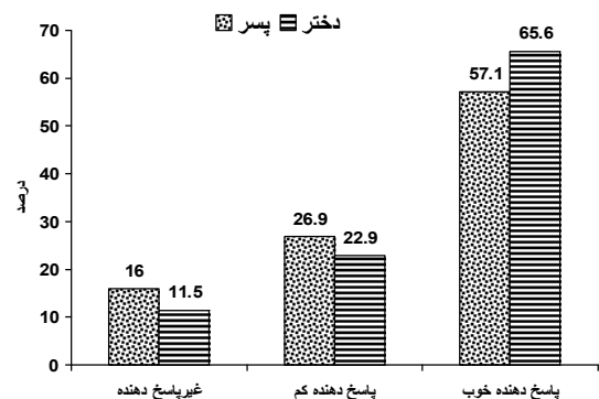
نمودار ۱: میزان پاسخ‌دهی به سه نوبت واکسیناسیون علیه ویروس هیپاتیت B در کودکان ۷ تا ۱۲ ماهه شهر گرگان به تفکیک جنس در سال ۱۳۸۵

در این مطالعه ۲۱۵ کودک ۷ تا ۱۲ ماهه شرکت داشتند که ۱۱۹ نفر (۵۵/۳ درصد) پسر و ۹۶ نفر (۴۴/۷ درصد) دختر بودند. در کل افراد مورد مطالعه ۸۶ درصد بالای ۱۰ واحد بین‌المللی Anti-HBs داشتند و پاسخ به واکسیناسیون را نشان می‌دادند و ۳۰ نفر (۱۴ درصد) نیز زیر ۱۰ واحد بین‌المللی این آنتی‌بادی را داشتند که نشان‌دهنده عدم پاسخ به واکسن بود. میانگین تیتراژ آنتی‌بادی علیه واکسن در کودکان مورد مطالعه در پسرها ۱۵۸/۴۸ با انحراف معیار ۱۲/۰۲ و در دخترها ۱۸۷/۵۵ با انحراف معیار ۱۳/۸۳ واحد بین‌المللی به دست آمد. میزان پاسخ‌دهی به سه نوبت واکسیناسیون در بین پسرها ۸۴ درصد و در بین دختران ۸۹/۹ درصد بود (نمودار ۱).