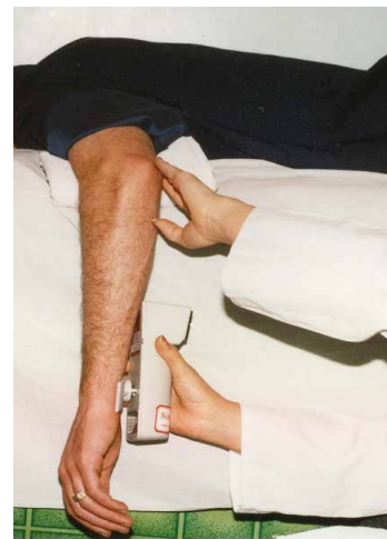
شکل ۲: نحوه اندازه‌گیری قدرت ایزومتریک حرکت چرخش داخلی

معیار انتخاب برای افراد سالم شامل تطابق داشتن سن، جنسیت، وزن و قد آنها با افراد بیمار بود.