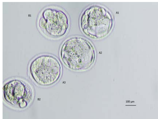
شکل ۲: رویان‌های مرحله بلاستوسیست (A1, A2, A3) و رویان‌های فراگمته (B1, B2) ۱۲۰ ساعت پس از لقاح تخمک‌های حاصل از تحریک تخمدان با استفاده از ترکیب تحریکی HMG و استرادیول والرآت