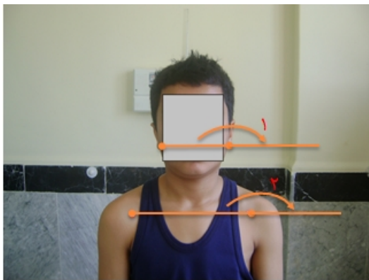
شکل ۲: روش اندازه‌گیری کج گردنی و شانه نابرابر (۱) زاویه کج گردنی، (۲) زاویه شانه نابرابر