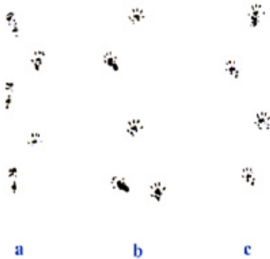
شکل شماره ۱- تصویر اندام عقب (Toes print) موش های گروه های مختلف هنگام راه رفتن جهت اندازه گیری SFI، دوازده هفته پس از ترمیم a) Collagen gel + PVDF b) Autograft c) Control

دهم، مقدار SFI در گروه های آزمایشی تغییر زیادی نداشت (شکل شماره ۱).