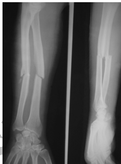
شکل شماره ۱- نمونه ای از شکستگی ها قبل از عمل

البته توانایی در حرکات ظریف دست تا حدی از دست رفته بودند. تمام شکستگی ها در رادیوگرافی در وضعیت مناسب جوش خوردند (شکل شماره ۲).