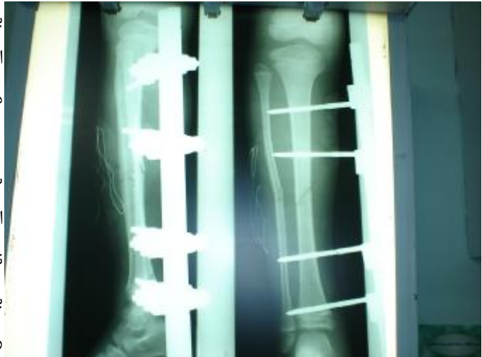
شکل شماره 3- پس از شکستن فیولا و ریداکشن تیبیا

در صورتی که یک استخوان دارای انحنا و یکی دچار شکستگی باشد (در یک قسمت اندام مثلاً ساعد) ابتدا باید انحنا اصلاح شود و سپس شکستگی ریداکشن گردد. ممکن است نتوان ریداکشن کامل بدست آورد ولی حد اقل 85% اصلاح را باید بدست آورد و بهتر است که هر هفته تا 2-3 هفته رادیوگرافی کنترل بگیریم تا از بروز مجدد انحنا مطلع شویم.