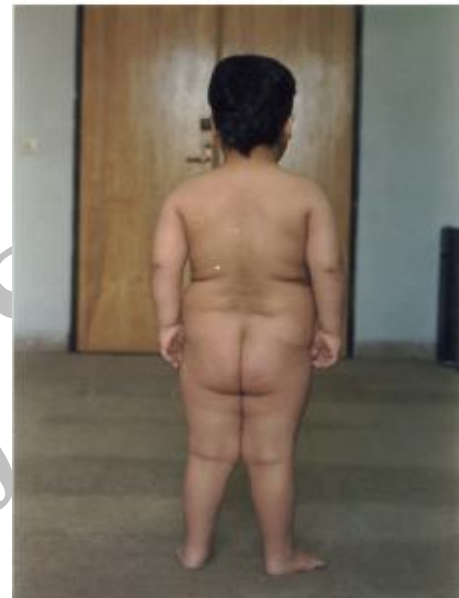
تصویر شماره 1- بیمار، پسر چهار و نیم ساله با الگوی چاقی