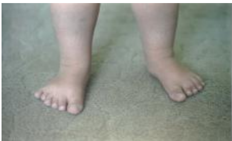
تصویر شماره 4- پلی داکتیلی در انگشتان پای راست، سینداکتیلی در انگشتان 2 و 3 پای چپ