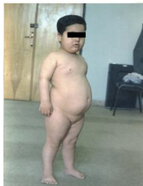
تصویر شماره 2- چاقی، هیپوگنادیسم، پلی داکتیلی در انگشت پای راست

خویشاوندان مبتلا ازدواج خویشاوندی به جز مورد والدین بیمار دیده شد. چاقی و فشار خون بالا در بین والدین و خویشاوندان مشترک مادری و پدری بیمار شیوع بالایی دارد. شواهد حاکی از هتروزیگوت ناقل بودن والدین برای ژن معیوب می باشد. از آنجا که ریسک تکرار بیماری برای فرزندان بعدی 25% میباشد، لذا توصیه های لازم به والدین صورت گرفت.